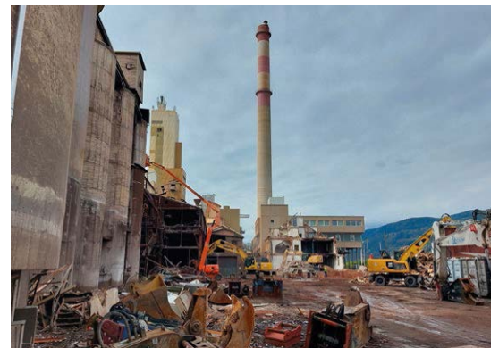
Der „Lange Ernst“ in Trieben. Ein Wahrzeichen der obersteirischen Industrie steht vor dem Abriss. Der RHI-Magnesita-Konzern macht Milliarden Gewinne, während in Trieben Ruinen zurückbleiben.

das die arbeitende Bevölkerung: durch hohe Arbeitslosigkeit einerseits und erhöhtem Druck auf die Beschäftigten andererseits. Es ist zu befürchten, dass die kommende Bundesregierung erst recht bei den Beschäftigten kürzt, anstatt die heißen Eisen anzugreifen: Etwa, den Energiesektor der Marktlogik zu entziehen und so für leistbare Preise zu sorgen.